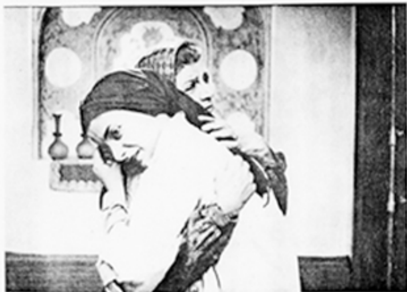
از اسب شاه حسینی

کارگردان: محمد علی نجفی مدد پر فیلمبرداران: محمد آلا پورس طراح صحنه و لباس: محسن شاه ابراهیمس طراح گریم: عبدالقده اسکندری، مشهور کارگردان: آریانا حاجیان، گروه کارگردانی: علامرضا کریمی، محمد رضا شریفی نیا، فرید صلتانی، فیلمبرداران: حسن یزدانی مدد پر تولید: سمید مدنی، گروه فیلمبرداران: عباد باغروز، رحیم بشارت، رضا قبادی، رضا بزرگنده، علی فولادی، علی نیازی، گروه طراحان و اسپشال افکت: مجید حمزه، اصغر مرسل، فرزانه مهری، اعظم مرسل، مشکین مهرگان، صدابرداران صحنه: احمد امیری، پداته نجفی اجرای گریم: محبوه اسکندری، مجید اسکندری، مستیار تولید: هدا پت الله پرومند پرنامهریز، علامرضا کریمی، معاهدنگی: عباس اردگانی، طراح حرکات موزون: فرزانه کاپلی، عکاس: مهران دمدار، منشی صحنه: افسانه حیدریان، مدد پر تدار کات: حسن انصاریان، تدار کات: محمد ولی احمدلو، اسلام بخش، پری فتح الهی، عباس کارگشا، ناصر آهنزازی، هماشوری، نده وین: محمد علی نجفی، موسیقی: بابک بیات، تهیه کننده: شهرداری اصفهان با همکاری وزارت فرهنگ و ارشاد اسلامی، بازیگران: درحام صدر، سرور نجفان اللهی، مهین شهباسی، محمد رضا شریفی نیا، علقی، افسانه حیدریان، محمود ملایانسی، داریوش بابائیان، ماندانا انصهانی، حمیرا بیگی، مشکین مهرگان، ناصر آهنزازی، جهانشاه و عده‌ای از دانشجویان دانشگاه پردیس و دانشکده زبانهای خارجی و علوم دانشگاه اصفهان.